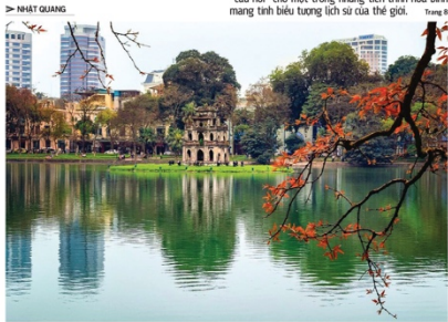
Hà Nội được chọn là địa điểm cho cuộc gặp Thương định lần hai giữa Mỹ và Triều Tiên

Hai thập kỷ sau khi được UNESCO vinh danh "Thành phố vì hòa bình", Hà Nội được lựa chọn là nơi tổ chức Hội nghị Thương định Mỹ - Triều lần hai, trở thành "câu nói" cho một tương lai tiến trình hòa bình mang tính biểu tượng lịch sử của thế giới.