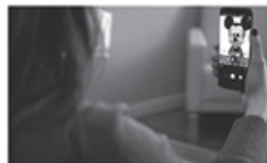
Samsung đưa nhân vật hoạt hình của Disney vào S9