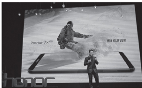
Honor chạy đua vào Top 3 điện thoại bán chạy tại Việt Nam