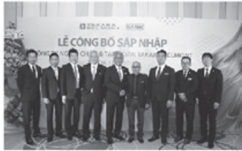
Cuối tháng 1.2018, một thương vụ mua bán và sáp nhập (M&A) đã lặng lẽ diễn ra, giữa một bên là Ngủ Á Châu, chủ thương hiệu Kanaco số 1 trong ngành mỹ phẩm hóa chất tóc ở Việt Nam và một bên là Takara Belmont, tập đoàn công nghiệp làm đẹp nổi tiếng ở Nhật. Đây là cuộc đầu tư gần như toàn bộ, khi Takara Belmont chấp nhận chi ra khoảng 900 triệu yên, tương đương hơn 18 tỉ đồng để đầu tư và sở hữu 97% vốn tại Ngủ Á Châu.

→ Ngành công nghiệp mỹ phẩm Hàn Quốc đang gặp khó → Mỹ phẩm Việt: Lọ Lem mơ thành công chúa