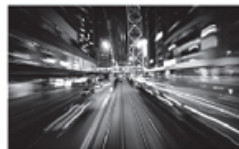
Việt Nam hưởng lợi từ cách mạng chuyển đổi số